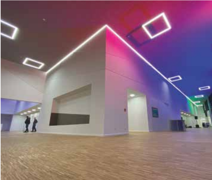
Großzügiges Foyer für Begegnung und Entspannung in Veranstaltungspausen

Multifunktional, modern und flexibel – so lässt sich die neue Stadthalle in Rheda-Wiedenbrück charakterisieren. An der Hauptstraße zwischen Rheda und Wiedenbrück gelegen und in direkter Anbindung an den Flora-Westfalica-Park ist ein zeitgemäßes kulturelles Zentrum entstanden, das bestens dazu geeignet ist, eine Strahlkraft über die Grenzen der Stadt hinaus zu entwickeln. Durch die gute verkehrstechnische Anbindung und den Parkplätzen direkt vor dem Gebäude ist es bequem erreichbar.